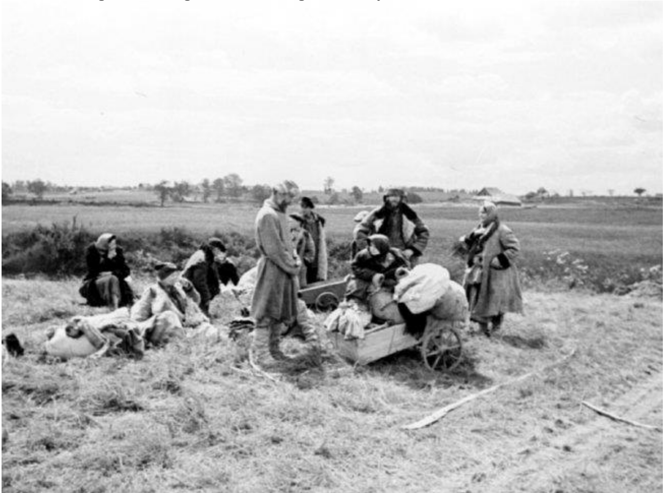
Беженцы. Псковская область. Июль 1941 г.

население они рассматривали лишь как продукт для своих человеконенавистнических экспериментов. Людей, способных к физической работе, они увозили в Германию для непосильного труда, а других, менее сильных и слабых – уничтожали. Многих детей и молодых людей ожидала жестокая участь смерти в результате проведения медицинских экспериментов. Те немногие, которые спаслись от ужасных мучений, никогда не забывали перенесенные страдания, причиненные врагом и чудо спасения.